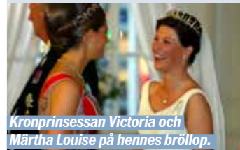
Kronprinsessan Victoria och Märtha Louise på hennes bröllop.

1 "På stora tillställningar när jag haft klänning och hela paketet, där det varit tio olika glas och lika många bestick. På mitt eget bröllop kände jag mig verkligen som en prinsessa."