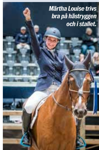
Märtha Louise trivs bra på hästryggen och i stallet.

Stallet ”Att mocka är ren lyx för mig. Jag älskar tystnaden och dofterna i stallet. Människor som rider är också överlag ett trevligt släkte.”