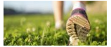
Att promenera i en hastighet av 100 steg i minuten ger positiva effekter på hälsan.

per minut för att få samma hälsoeffekter, och ibland räckte det med några steg färre. (TT)